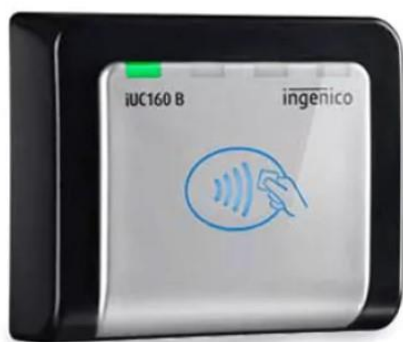
Platební terminál iUC 160B