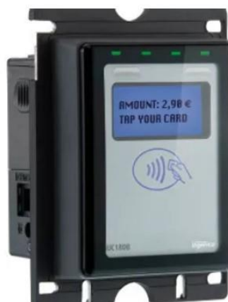
Platební terminál iUC 180B